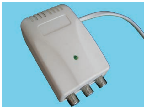
Articolo 7006F Item 7006F