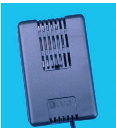
Articolo 7002 Item 7002