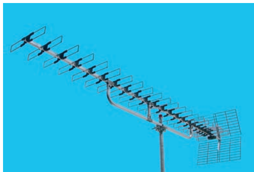
Articolo 9245 Item 9245

(*) suitable for vertical and horizontal mounting (***) auxiliary boom